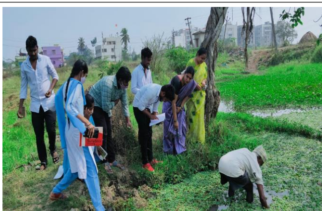
Identification of various biotic factors

Various Biotic components which include producers, consumers, decomposers and abiotic components which include organic and inorganic materials were observed by students and results were analysed at various levels in pond. They could now able to understand and co-relate abiotic and biotic components of nature and their interdependence is well understood