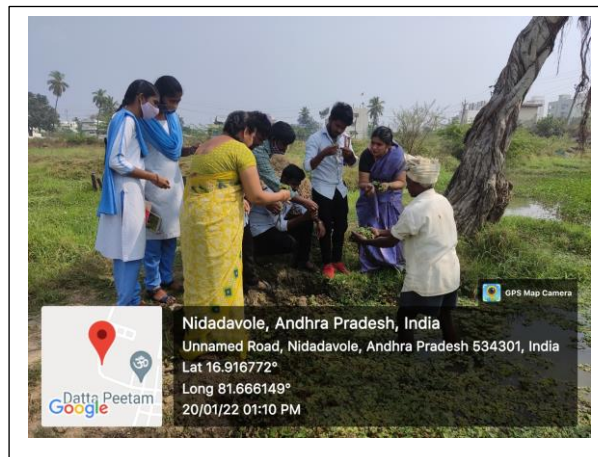
Students analyzing various levels of pond vegetation